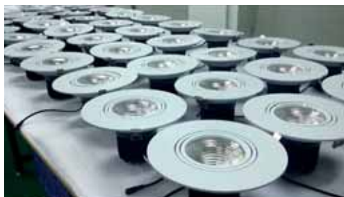
Einbauleuchten für Ladenbau und Gallerien