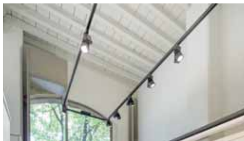
Licht auf den Punkt für Shops, Gallerien und privat

Unsere Kunden vertrauen darauf: Wir liefern exakt die LED-Lösungen, die sie benötigen.